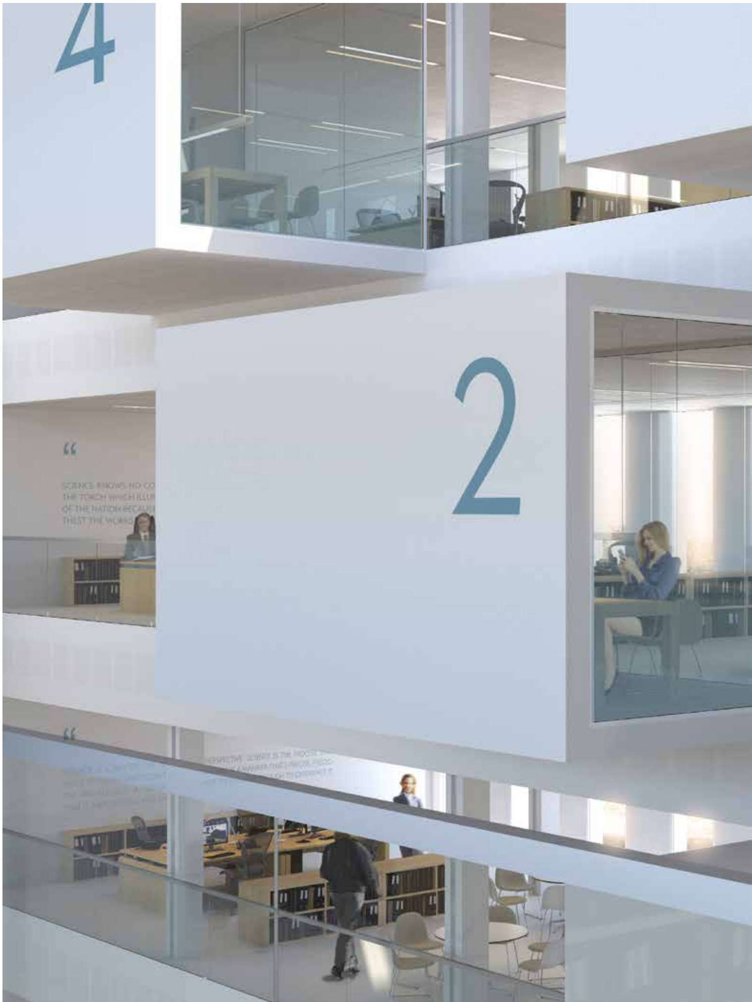
10 - Gyptone® Quattro 70 - Akustikundertak- och väggar med fina perforeringar